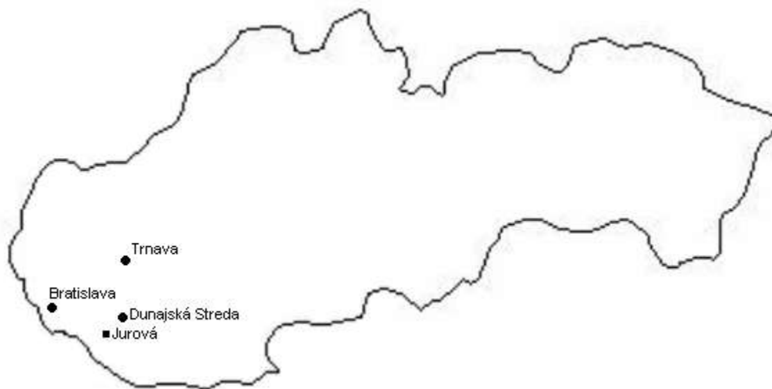
Mapa 1: Poloha obce Jurová na Slovensku vo vzťahu k hlavnému mestu, krajskému centru a obvodnému/okresnému mestu