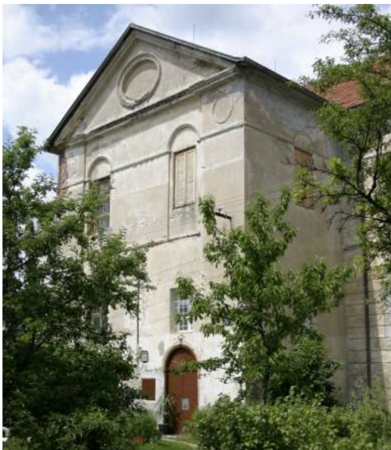
Obrázok 9 Budova kaštieľa 1

Možnosti rozvoja rekreácie a cestovného ruchu v širšom okolí obce sú veľmi rozsiahle a rôznorodé.