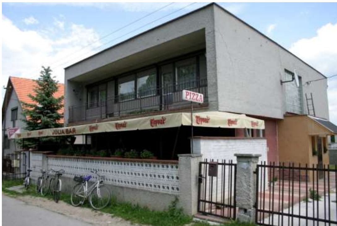
Obrázok 8 Reštauračné služby v obci