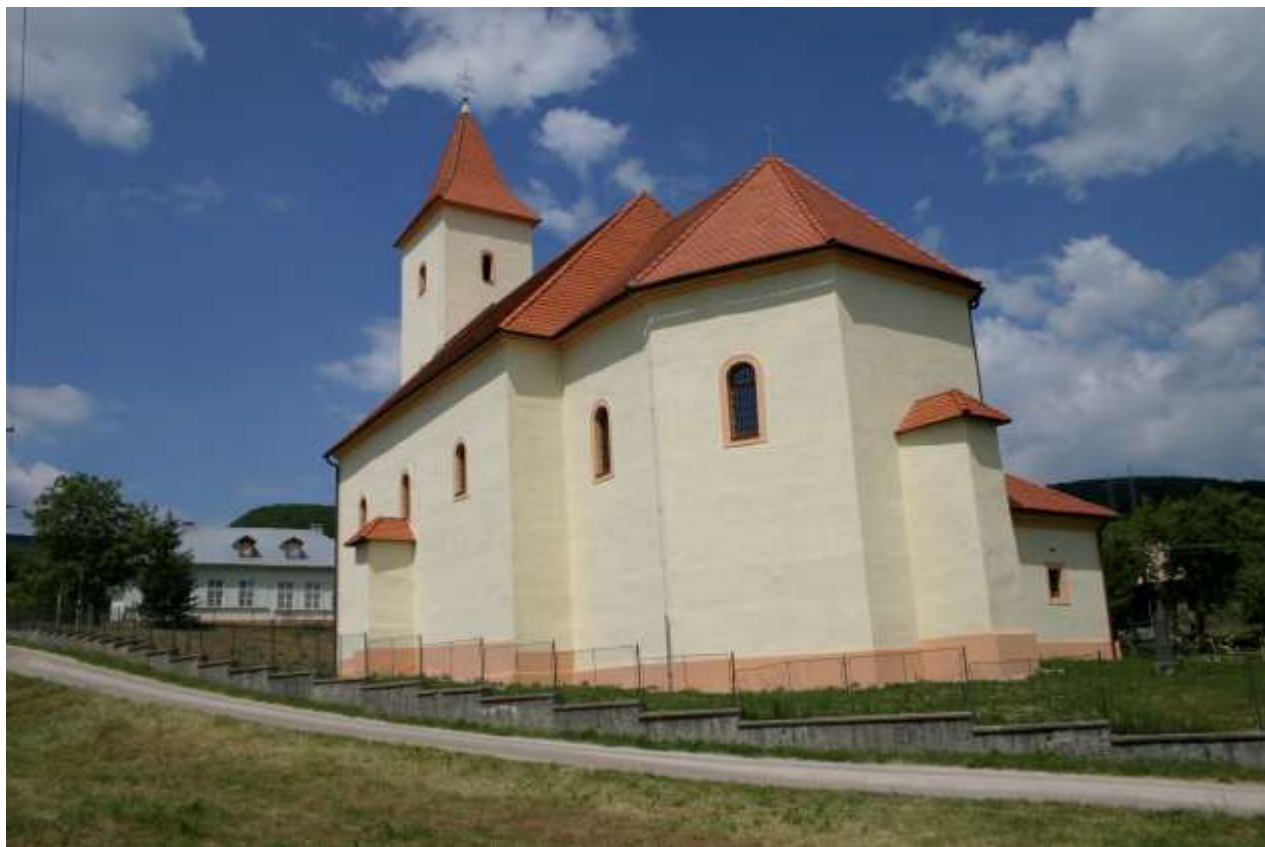
Obrázok 2. Katolícky kostol

V obci je činný folklórny súbor Novjesanka združujúci občanov so vzťahom k folklóru a ľudovým tradíciám. Tunajšie tradície šíria prostredníctvom vystúpení nielen domácim obyvateľom ale aj širšieho regiónu a celého Slovenska. Z tradičných kultúrnych akcií je známa akcia „Spieva celá dedina“, v ktorej sú zapojení občania všetkých vekových kategórií. Členovia súboru sa podieľajú na spoluorganizovaní Novianskych dní, ktorých súčasťou je predstavovanie ľudových remesiel a vystúpenia folklórnych súborov. Ďalším spolkom s orientáciou na kultúrne aktivity je Slovenský zväz zdravotne postihnutých. Združuje 125 členov pre ktorých organizuje rôzne kultúrne aktivity. V rámci vianočného posedenia organizuje výstavu ručných prác svojich členov. Zväz sídli v priestoroch starej materskej školy, ktorá je v súčasnosti v nevyhovujúcom stave. Poslednou všeobecne prospešnou organizáciou s orientáciou na kultúru je Občianske združenie Kabianka. Zameriava sa na organizovanie kultúrnych podujatí pri rôznych spoločenských príležitostiach. Každoročne organizuje pre deti a ich rodičov spoločensko-kultúrnu akciu „Cesta rozprávkovým lesom“. V obci je činný aj Slovenský zväz protifašistických bojovníkov.