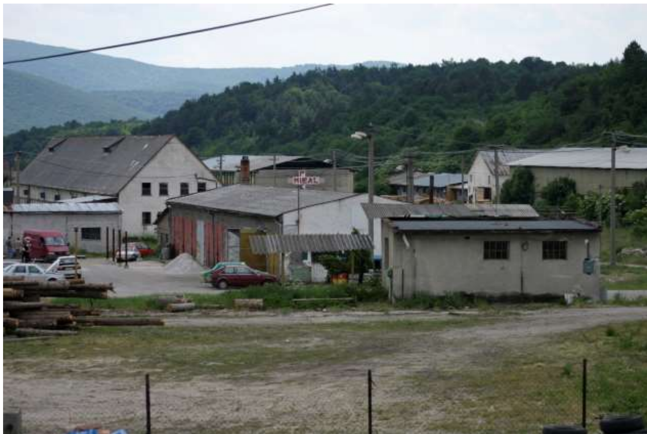
Obrázok 5 Priemyselná časť obce

Funkciu zásobovania obce základným spotrebným tovarom plnia 4 malometrážne predajne s potravinami, jedna predajňa zameraná na predaj ovocia a zeleniny a predajňa so zmiešaným tovarom. V obci ponúkajú živnostníci výkon prác spojených so spracovaním dreva.