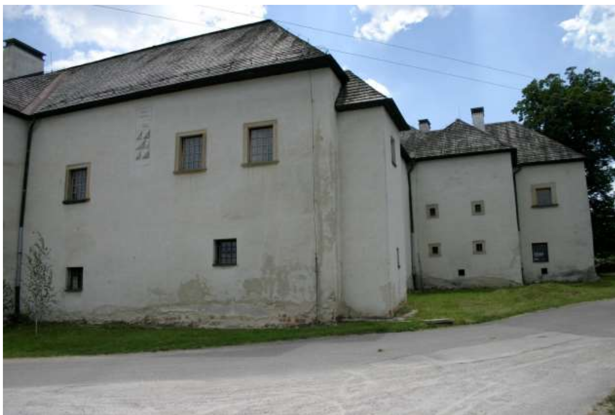
Obrázok 13 Budova kaštieľa 3