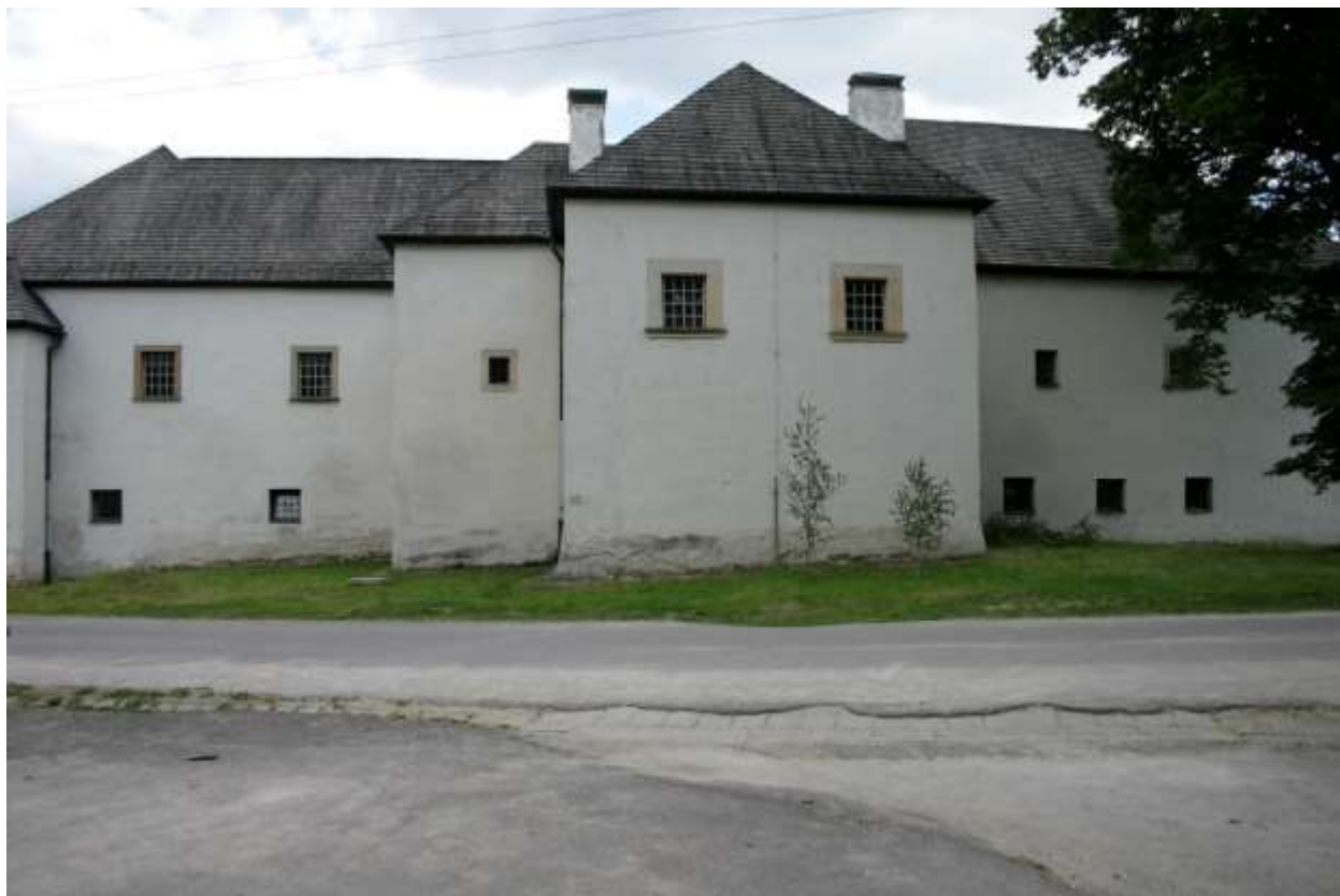
Obrázok 12 Budova kaštieľa 2