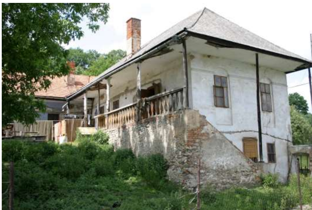
Obrázok 10 Historická budova

Potenciál územia regiónu charakterizujú rozvinuté podmienky pre kúpeľný cestovný ruch, letný pobyt pri vode, horskú turistiku a rekreáciu, vidiecky turizmus a v menšej miere aj zimné športy.