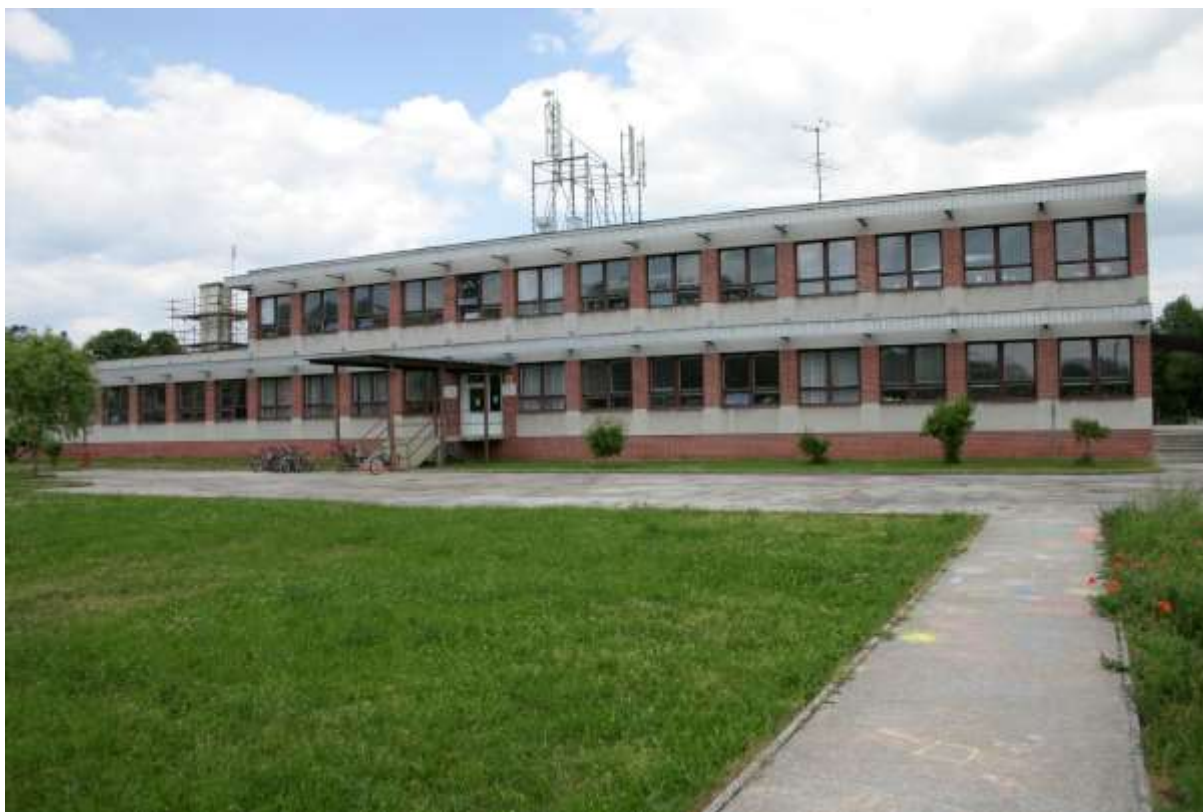
Obrázok 6. Budova školy Diviacka Nová Ves

Čo sa týka materiálneho vybavenia základnej a materskej školy, postupne zastaráva a stáva sa nevyhovujúcim z hľadiska jeho ďalšieho využitia na pedagogické účely. V priebehu budúcich rokov obec plánuje postupnú obnovu a doplnenie materiálneho vybavenia, aby škola spĺňala bežné štandardy základných škôl.