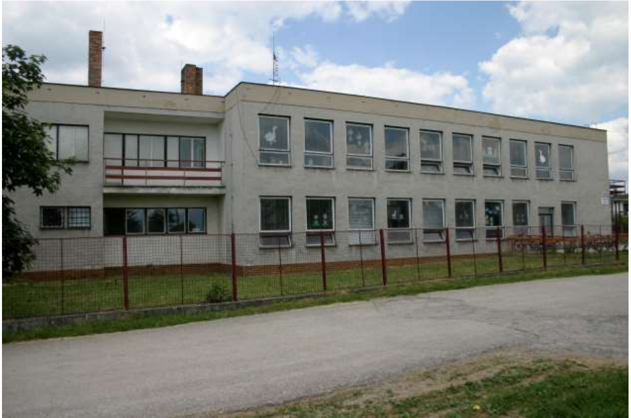
Obrázok 7. Budova materskej školy Diviacka Nová Ves

pracovných prostriedkov, čistiacich prostriedkov, ako aj morálne a fyzicky opotrebovaného a znehodnoteného materiálu a vybavenia, najmä v školských stravovacích zariadeniach. Z dôvodu absolútneho nedostatku finančných prostriedkov na bežnú prevádzku škôl a školských zariadení sa nerealizuje v potrebnom rozsahu údržba chátrajúceho majetku v správe škôl a školských zariadení, čo sa nepriaznivo prejavuje na často sa vyskytujúcich havarijných situáciách.