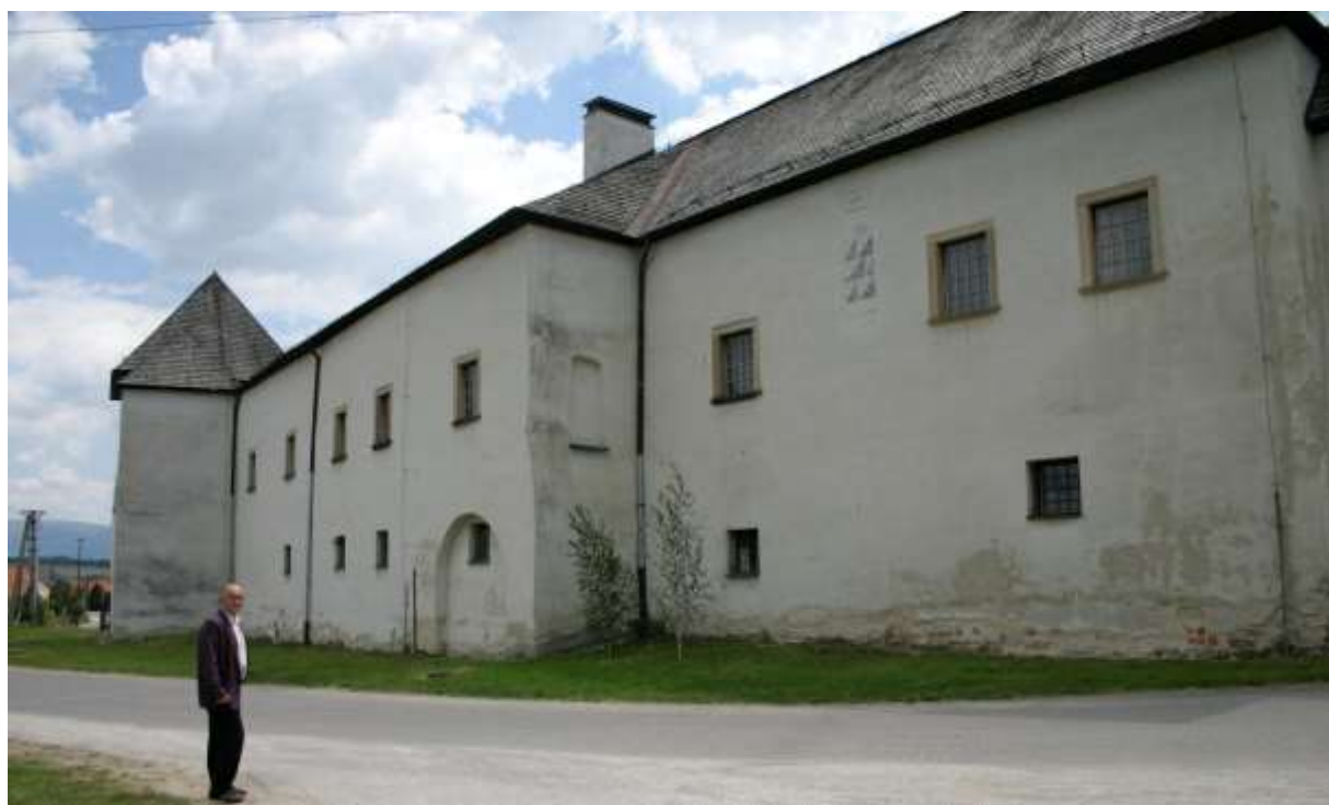
Obrázok 11 budova kaštieľa 1

Rezervy sú najmä vo využití kultúrno-historického potenciálu pre poznávací turizmus. Obec disponuje veľkým množstvom historických pamiatok, ktoré sú v súčasnosti v zlom technickom stave.