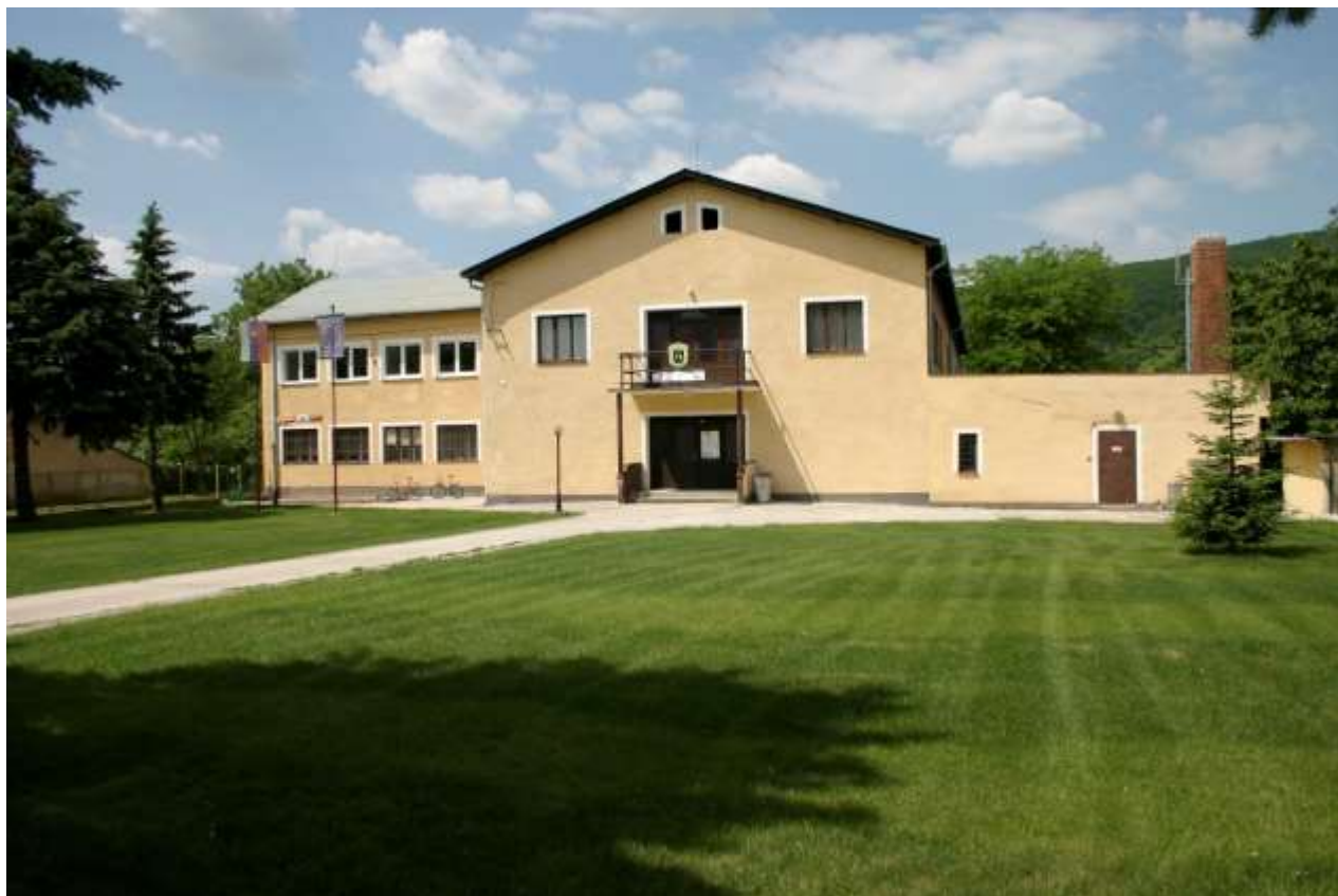
Obrázok 14. Budova obecného úradu