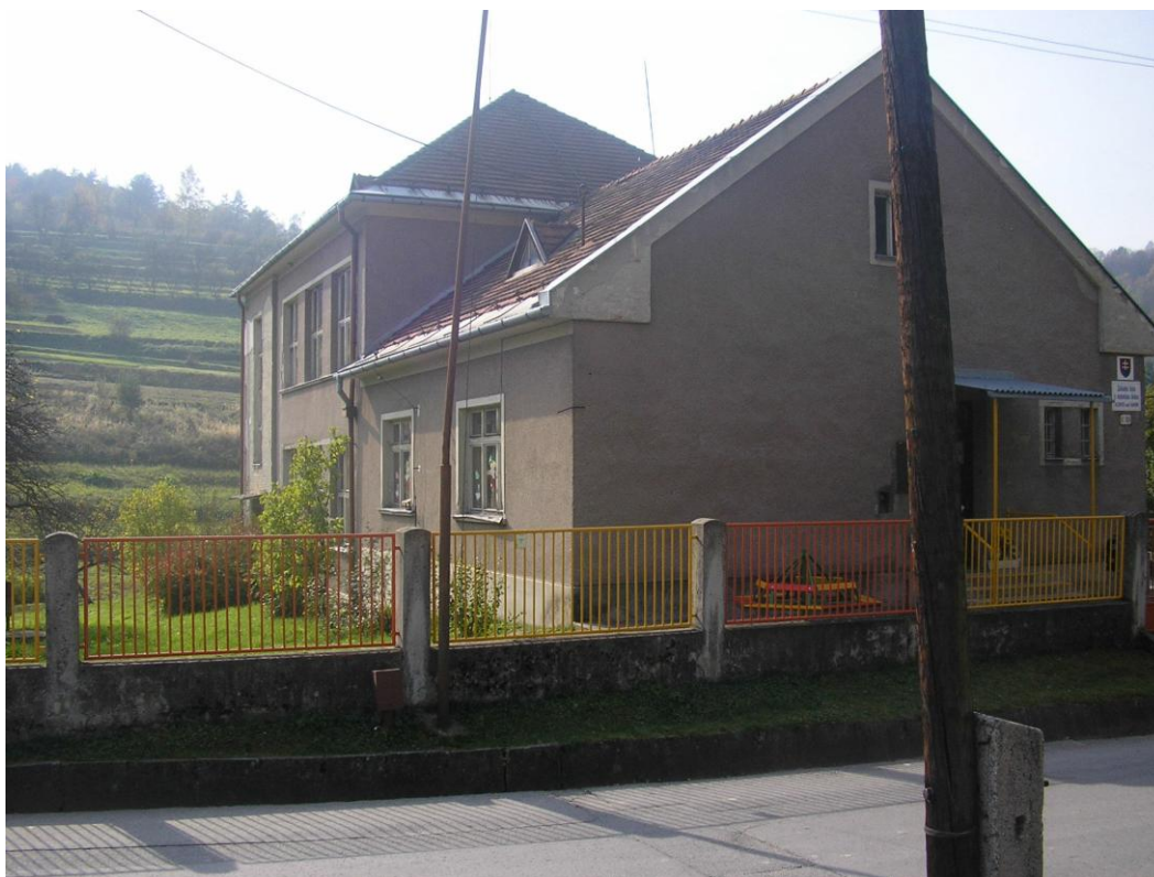
Obr. č. 3 Budova základnej školy s materskou školou