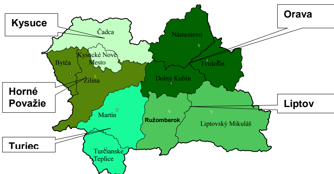
Obr. č. 1: Mapa Žilinského samosprávneho kraja

Obec sa rozprestiera na Hornom Považí oblasť Strážovské vrchy, ktorá sa viaže na dva orografické celky: Strážovské vrchy a Súľovské vrchy. Je to kotlina obklopená zo všetkých strán kopcami a názvami: Kolárovec, Ostrý vrch, Hrabovský vrch, Lípie. Obec Hlboké nad Váhom susedí s obcami: z východnej strany s Hričovským Podhradím, so západnej strany s Hrabovým. Rieka Váh, ktorá preteká okolo katastra obce, susedí s obcou Kotešová, mestom Bytča (Hliník). Pólom miestneho významu je mikroregión Bytčianskej kotliny (člen euroregiónu Beskydy), ktorý združuje 11 obcí (Hvozdnica, Štiavnik, Petrovice, Kolárovice, Veľké Rovné, Kotešová, Predmier, Maršová – Rašov, Hlboké nad Váhom, Jablonové, Súľov – Hradná) a mesto Bytča.