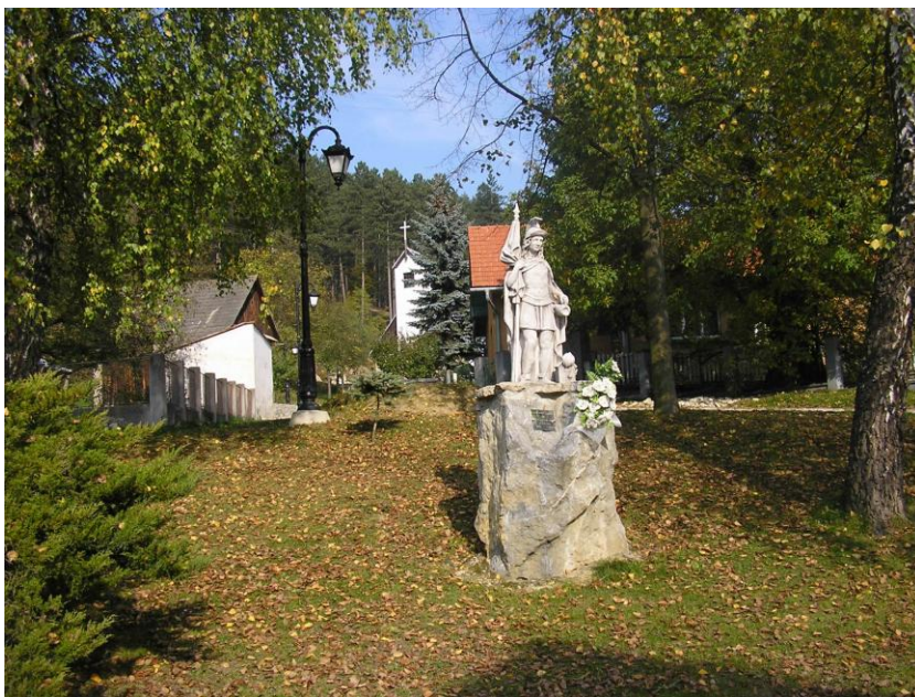
Obrázok č. 1 Socha patróna hasičov Sv. Floriána

V období po roku 1918 obce Dolné a Horné Hlboké administratívne patrili do okresu Veľká Bytča. Na konci druhej svetovej vojny boli obe obce vyrabované a vyplienené ustupujúcou nemeckou armádou. Dňa 30. apríla boli obce oslobodené jednotkami 1. Československého armádneho zboru. Ihneď po roku 1945 začali občania svoje obce zveľaďovať. Stavali sa nové rodinné domy, aj hospodárske objekty, opravovali sa miestne prašné komunikácie i poľné cesty, upravovali sa urbárske pasienky. V roku 1947 sa prestali používať petrolejky, kahany a sviece, lebo do obcí Dolné a Horné Hlboké bola zavedená elektrina. V roku 1955 sa v Dolnom Hlbokom začala stavať hasičská zbrojnica a následne kultúrny dom. Oba objekty boli slávnostne sprístupnené v roku 1966.