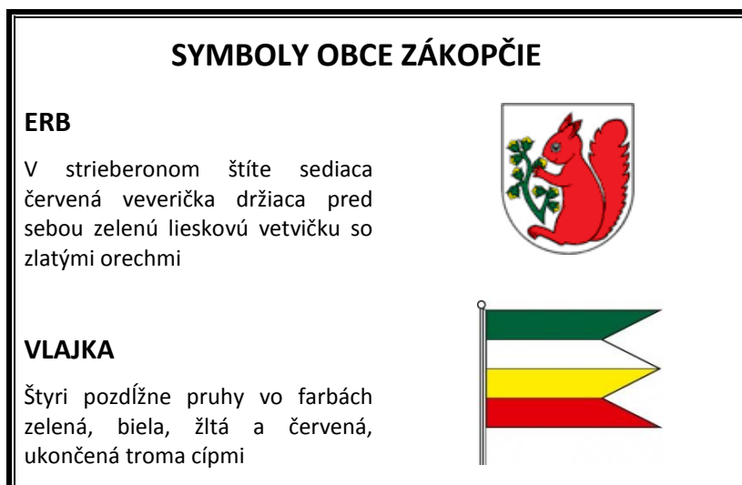
Obrázok 2 Symboly obce Zákopčie