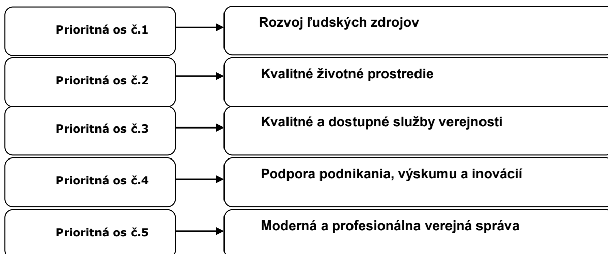
Schéma prioritných osí PHSR obce Valča:

Pre naplnenie dlhodobej vízie mesta boli v PHSR obce Valča stanovené nasledovné strategické ciele: