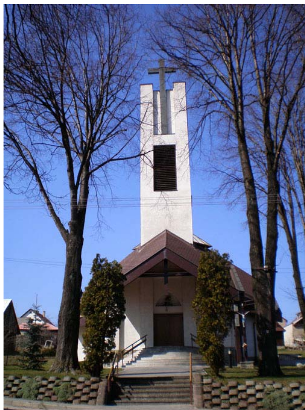
Kostol sv. Jána a Pavla