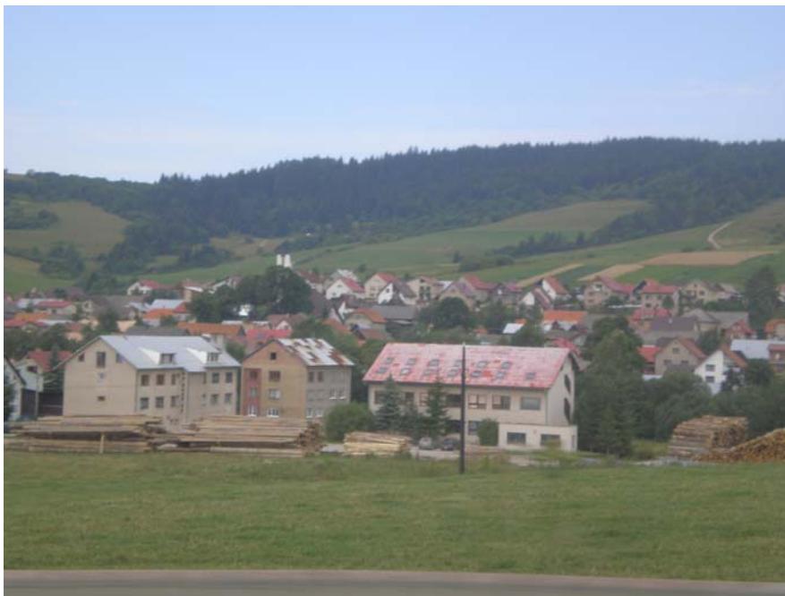
Pohľad na obec