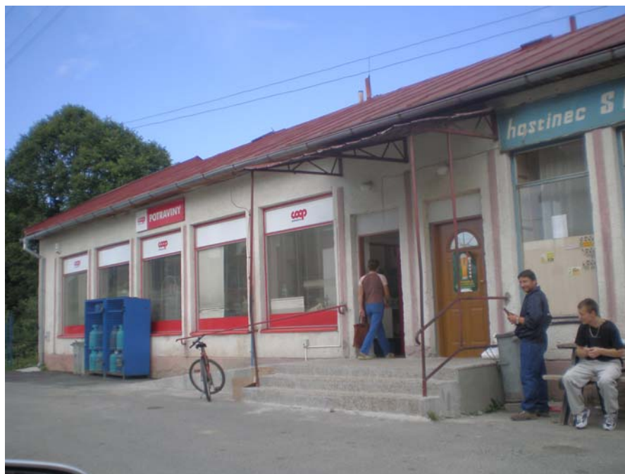
Predajňa a hostinec