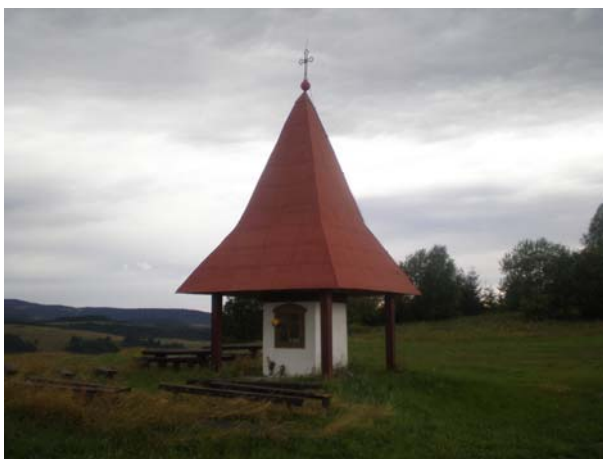
Kaplnka Panny Márie

Z historických pamätihodností sa na území obce zachoval oltár Panny Márie, z r. 1918 s barokovými sochami a bočným oltárom z 1. polovice 18. storočia. Tento oltár je umiestnený v dome smútku v našej obci. Kaplnka Panny Márie bola zrekonštruovaná v roku 1997 a vežička na nej pochádza z pôvodného kostola.