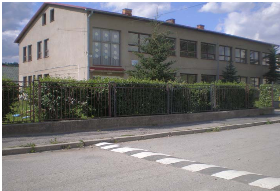
Materská a základná škola

V obci Vasíľov sa nachádza základná malotriedna škola, na ktorej sa v súčasnosti učí 36 detí (I. stupeň) a materská škola s 26 deťmi. Základná škola má 6 počítačov napojených na internet. Obec nemá dom dôchodcov, v obci sú tradičné viacgeneračné domácnosti – dôchodcovia využívajú starostlivosť svojich potomkov.