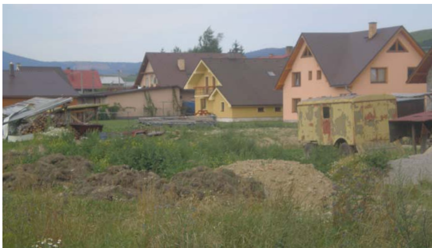
Výstavba rodinných domov

V obci a jej bezprostrednom okolí sa nachádza nákupné stredisko, ktoré je súčasťou reťazca COOP Jednota, pohostinské zariadenie nižšej cenovej skupiny a zaujímavo riešené reštauračné zariadenie Koliba.