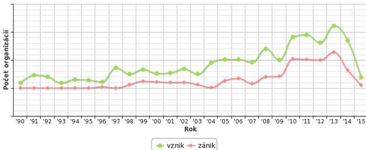
Trend vzniku a zániku organizácií od roku 1990

Zdroj: http://naseobce.sk/mesta-a-obce/2624-liptovska-luzna/firmy-a-organizacie