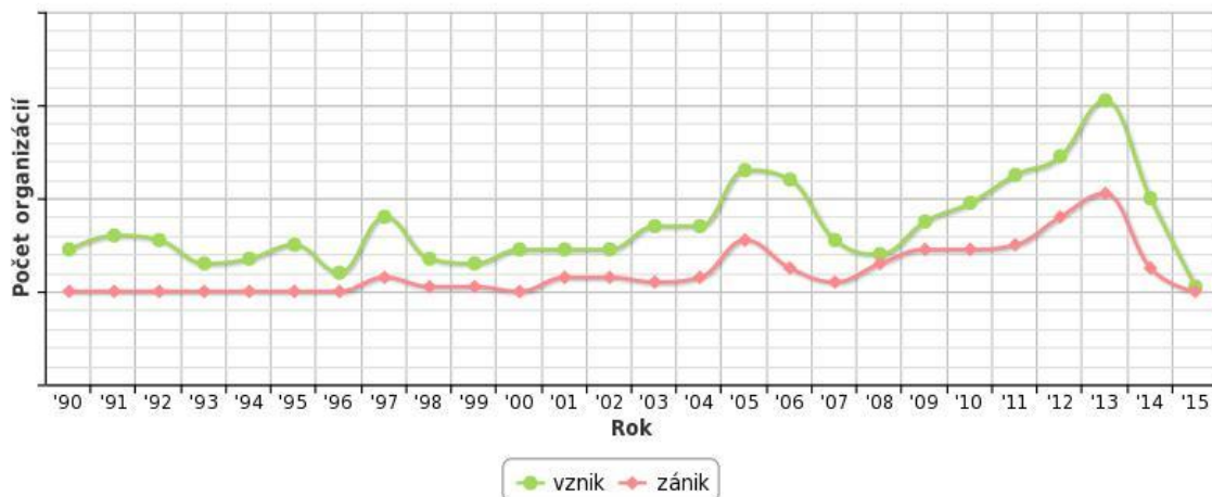
Trend vzniku a zániku organizácií od roku 1990