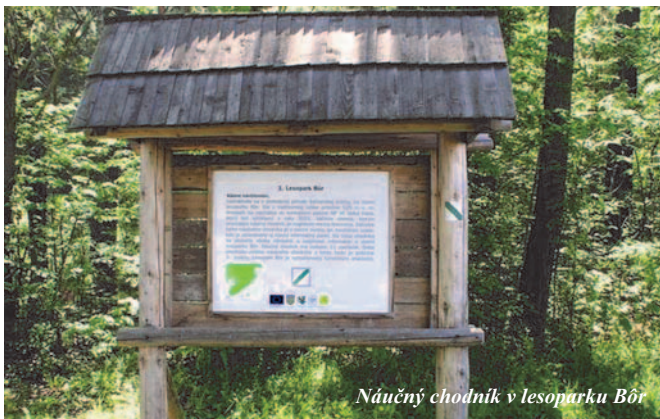
Náučný chodník v lesoparku Bôr

Mesto Turčianske Teplice sa snažilo aj v minulosti postupnými krokmi zabezpečovať rozvojové aktivity mesta v oblasti ochrany životného prostredia, vzdelávania, sociálnej a zdravotníckej starostlivosti o občanov, cestovného ruchu a turizmu, ale aj informatizácie, dopravy a investícií všeobecne. Podalo tiež viacero projektov a čerpalo prostriedky z predvstupových fondov, z fondov ministerstiev SR a v súčasnosti aj z fondov Európskej únie.