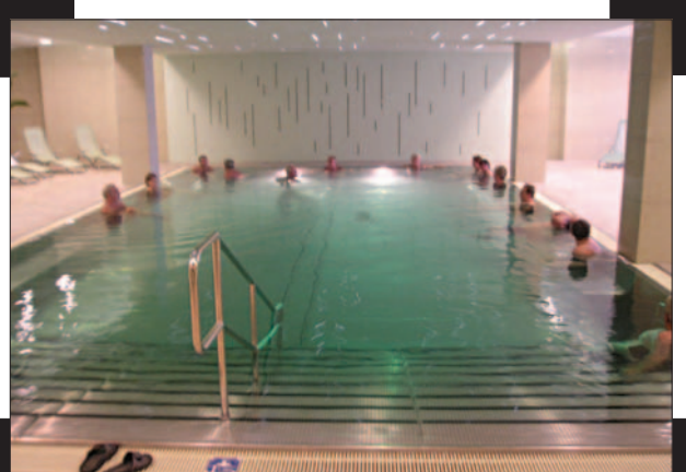
Smaragdový bazén 07/2005