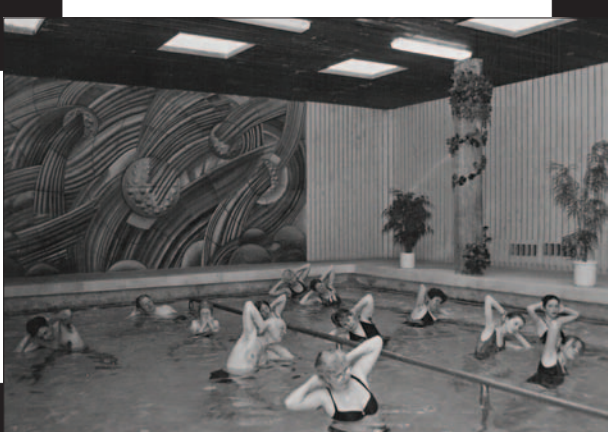
Biely bazén 08/2000