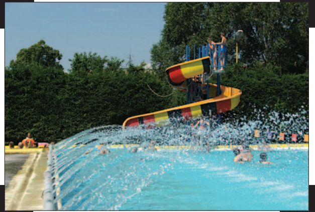
Kúpalisko Vieska 07/2006