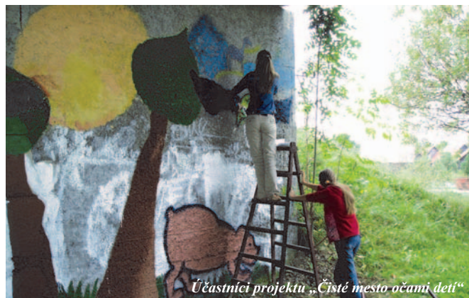
Účastníci projektu „Čisté mesto očami detí“