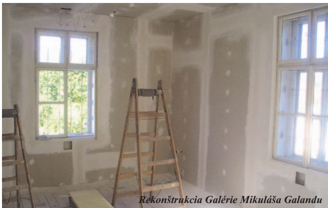
Rekonštrukcia Galérie Mikuláša Galandu