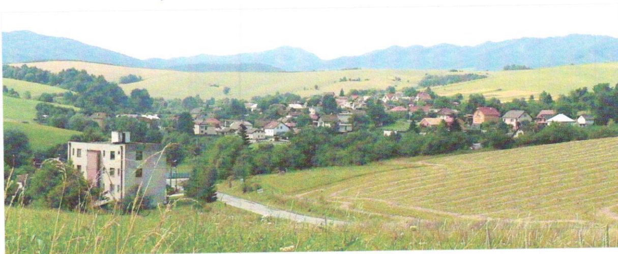
Pohľad na obec Brezany