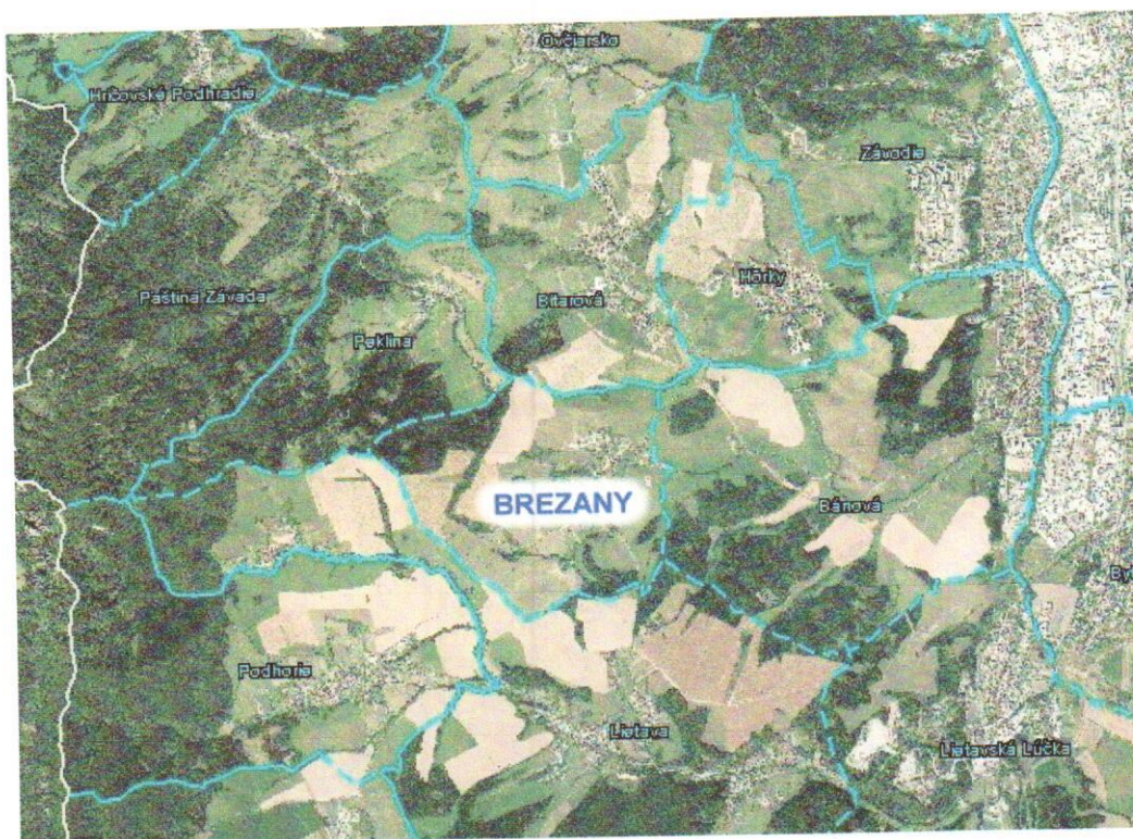
Obec Brezany na mape