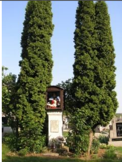
Sakrálna plastika zakrytá tujami