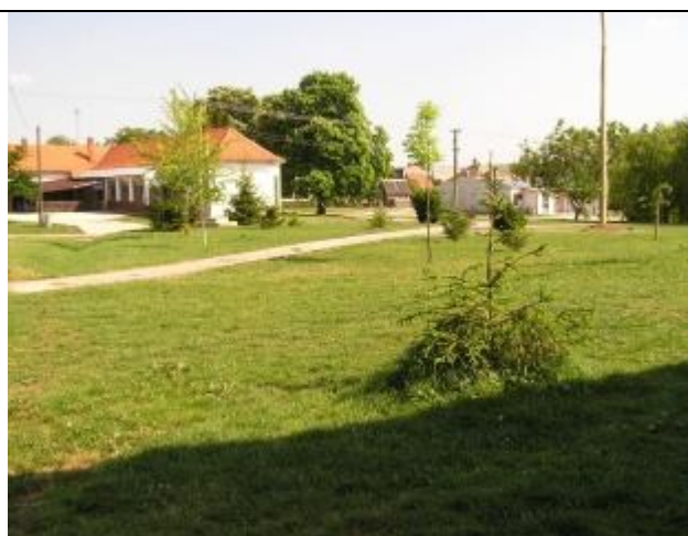
Centrum obce – budúci verejný park

Obec je dlhodobo zameraná na poľnohospodársku produkciu. Keďže v súčasnosti je v rámci Európy nadprodukcia potravín, je vhodné poľnohospodársku činnosť diverzifikovať. Jednou z možností využitia poľnohospodárskej pôdy je výroba biomasy a následne jej využitie ako alternatívneho zdroja energie.