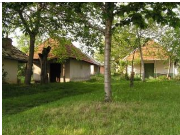
Tradičné hajlochy medzi ovocnými stromami