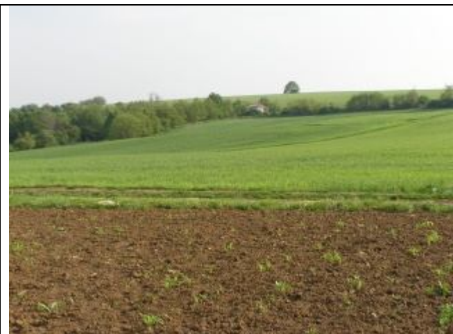
Veľkoplošné obrábanie pôdy. Na horizonte je solitérny strom - „kráľovský strom“.

Ďalším významným prvkom v krajine sú historické štruktúry využívania krajiny , ktoré sú rozložené na miernom južnom svahu nad Dyčianskou dolinou. Je to mozaika tvorená úzkymi pásmi porastov viniča, ovocných sádov a ornej pôdy, ich súčasťou sú hajlochy (vínne domčeky). Táto historická krajinná štruktúra tvorí zároveň rekreačný potenciál pre obyvateľov obce. V minulosti sa v katastrálnom území vyskytoval tiež vyšší podiel ovocných drevín, z ktorých prevládali čerešne a orechy, pri vinných domčekoch boli tiež slivky. Na niektorých miestach je táto tradícia dodržaná, pri niektorých vinných domčekoch (najmä pri prestavaných) sú tieto tradičné dreviny nahradené novými, nepôvodnými druhmi. Ovocné dreviny sú v súčasnosti najviac zastúpené v jestvujúcich súkromných vinohradoch. Avšak z územia mimo záhrad ovocné druhy prakticky vymizli.