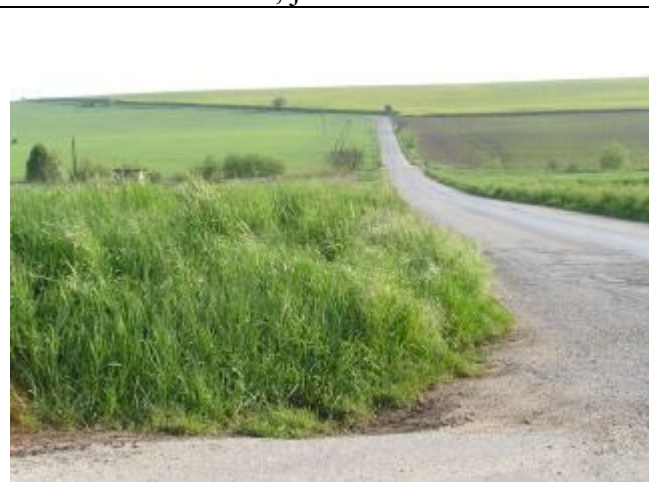
Intenzívne obrábaná orná pôda. V krajine chýba sprievodná zeleň komunikácií

Ekologická stabilita územia: Územie je pomerne málo ekologicky stabilné s nízkym rekreačným potenciálom. Je chudobné na lesné porasty, na drevinnú mimolesnú vegetáciu. V katastri Klasova prevláda veľkoplošné hospodárenie, ktoré je užívateľmi pôdy praktizované i v súčasnosti. Ochrana prírody a krajiny nemá v katastrálnom území žiadne záujmy, len vodná nádrž Vráble spadá do chráneného vtáčieho územia, ktoré z časti zasahuje i do katastra obce Klasov. Na celé územie sa vzťahuje len I.stupeň ochrany – všeobecná ochrana. Z ekostabilizačných prvkov má najväčší význam lokálne biocentrum pri vodnej nádrži Vráble, to však do záujmového územia obce spadá len okrajovo. Pomerne dobre je vyvinutá sprievodná zeleň Babindolského potoka a jeho pravobokého prítoku – Klasovského potoka. V ich sútoku sa tiež nachádza zamokrené územie s vlhkomilnými rastlinami, toto územie je vhodné chrániť, jedná sa o významný interakčný prvok v krajine. Sprievodná zeleň komunikácií je tvorená najmä orechmi a čerešňami, je medzi obcami Klasov-Babindol a v smere od Klasova na Vráble..