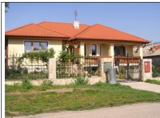
Nové, nepôvodné prvky: sklon strechy, výklenok, oplotenie...