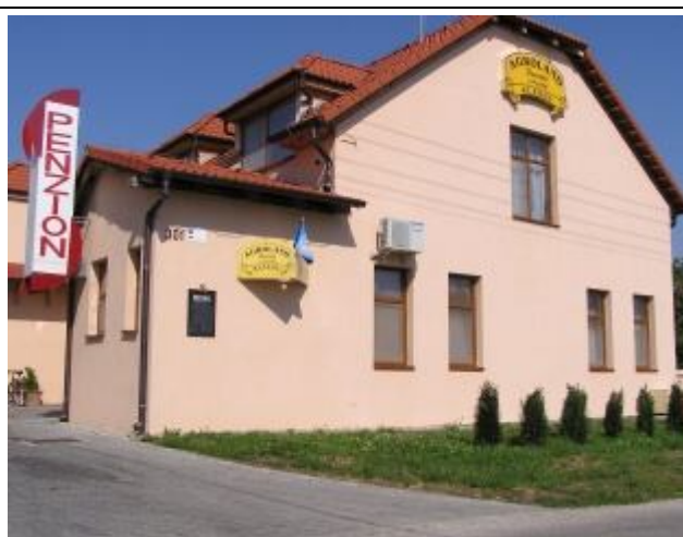
Penzión Agroland – ubytovanie a stravovanie.

Okrem toho sa v obci dlhodobo prejavuje trend k samozásobiteľstvu.