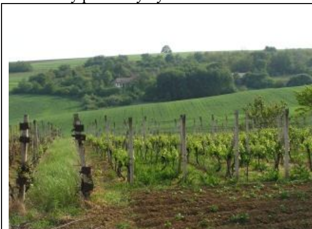
Tradičný agroekosystém – vinice a sady

Ďalším významným prvkom v krajine sú historické štruktúry využívania krajiny , ktoré sú rozložené na miernom južnom svahu nad Dyčianskou dolinou. Je to mozaika tvorená úzkymi pásmi porastov viniča, ovocných sádov a ornej pôdy, ich súčasťou sú hajlochy (vínne domčeky). Táto historická krajinná štruktúra tvorí zároveň rekreačný potenciál pre obyvateľov obce. V minulosti sa v katastrálnom území vyskytoval tiež vyšší podiel ovocných drevín, z ktorých prevládali čerešne a orechy, pri vinných domčekoch boli tiež slivky. Na niektorých miestach je táto tradícia dodržaná, pri niektorých vinných domčekoch (najmä pri prestavaných) sú tieto tradičné dreviny nahradené novými, nepôvodnými druhmi. Ovocné dreviny sú v súčasnosti najviac zastúpené v jestvujúcich súkromných vinohradoch. Avšak z územia mimo záhrad ovocné druhy prakticky vymizli.