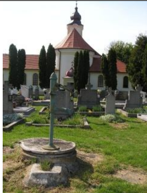
Vodný prvok na cintoríne