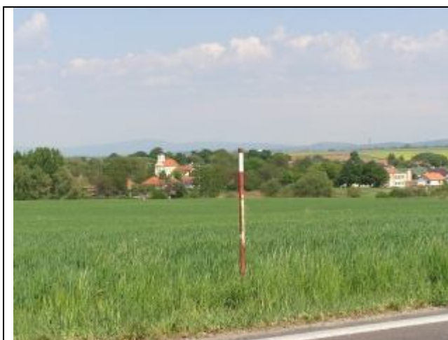
Pohľad na obec od cesty I/51 – zelená oáza

Keďže pre občanov tradičné živnosti a remeslá stratili punc identity a lukratívnosti, je v obci snaha podporiť modernú priemyselnú zónu s novými technologickými procesmi, prípadne podporiť nové aktivity, ako sú obchodovanie, prevádzkovanie nevýrobného sektoru apod..