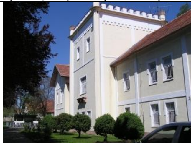
Neogotický kaštieľ baróna Weisza z roku 1866