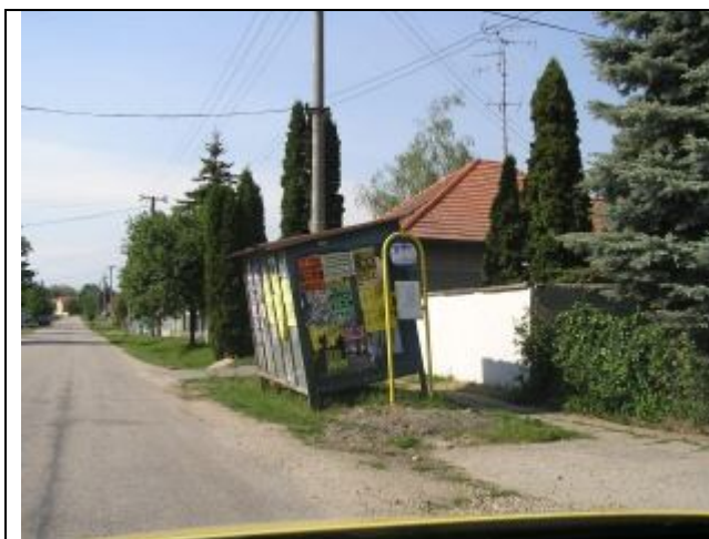
Autobusová zastávka pri hlavnej ceste v obci.