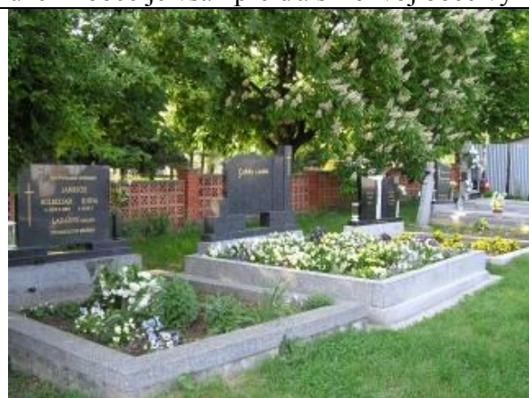
Vzorovo a v duchu slovanskej tradície upravené hroby – kobercové výsadby kvetov

Trasovanie inžinierskych sietí bude spresnené v rámci prieskumov a rozborov k UPD a tiež bude stanovené ich ochranné pásmo na základe rokovaní so správcami sietí. Tieto prieskumy neboli predmetom analýz spracovávaných v rámci PHSR. Informácia o ich prítomnosti v katastrálnom území obce je však pre ďalší rozvoj obce významným faktorom.