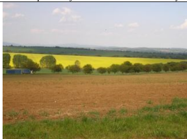
Sprievodná zeleň cesty I/51 – orechová alej

Zeleň zastavaného územia: Pozitívom je pomerne dobré zastúpenie zelene v zastavanom území obce, jadro systému zelene tvorí park pri kaštieli s historickými stromami, ďalej areálová zeleň pri objektoch občianskej vybavenosti (MŠ a ZŠ) a tiež v uliciach (široké pásy zelene s možnosťou uplatniť nové výsadby stromov). V obci, priamo v centre, sú tiež voľné plochy pre tvorbu nových, kvalitných plôch zelene (medzi Obecným úradom, knižnicou, poštou a predajňou Jednota). Štúdiá na úpravu tejto plochy už bola obcou spracovaná. Ďalšou možnou plochou na úpravu je cintorín, kde v súčasnosti prevládajú tuje – dreviny statické, tvoriace nepreniknuteľnú bariéru. Ďalej chýba zeleň po obvode zastavaného územia (zelený prstenec obce), ktorý by mal tlmieť prenášanie tuhých znečisťujúcich látok do obce z polí pri silnom prúdení vetra. Vytvorenie takéhoto prstenca je možné v rámci Pozemkových úprav, ktoré sa v obci začínajú spracovávať.