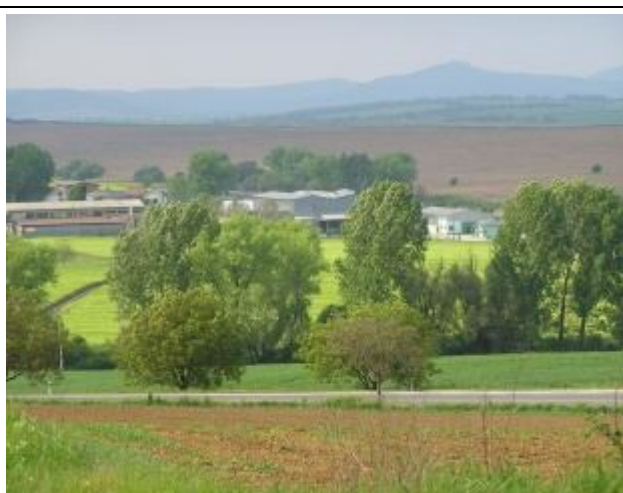
Areál firmy Triticum. V pozadí hrad Gýmeš.

Na základe uvedeného je možné konštatovať, že obec je zameraná vo veľkej miere i v súčasnosti na poľnohospodárstvo, na čo má i predpoklady. Predsa však tu hrozí riziko v období klimaticky a mikroklimaticky nevhodných podmienok či katastrof. Poľnohospodársku výrobu je potrebné diverzifikovať, hľadať nové možnosti produkcie (patentované produkty a výrobky), nové technologické postupy (resp. stavať na tradičných technologických postupoch), veľkoplošné hony rozdrobiť a pestovať pestrejší sortiment, pestovať napr. energetické plodiny a rastliny ako alternatívne zdroje energie, využívať pri plánovaní neďalekú SPU v Nitre a jej potenciál apod.