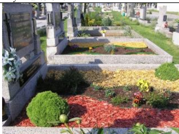
Mulčovacia kôra na hrobe namiesto kvetinovej výsadby