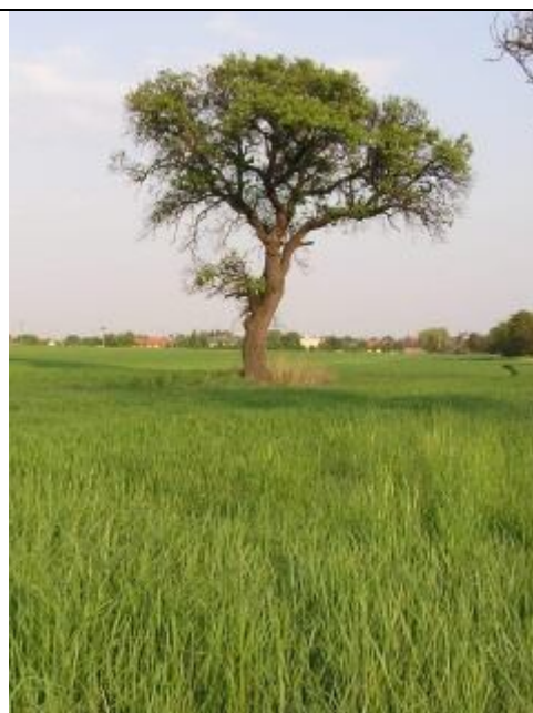
Stará hruška na hranici katastrálnych území KLASOV a BABINDOL.

Zeleň zastavaného územia: Pozitívom je pomerne dobré zastúpenie zelene v zastavanom území obce, jadro systému zelene tvorí park pri kaštieli s historickými stromami, ďalej areálová zeleň pri objektoch občianskej vybavenosti (MŠ a ZŠ) a tiež v uliciach (široké pásy zelene s možnosťou uplatniť nové výsadby stromov). V obci, priamo v centre, sú tiež voľné plochy pre tvorbu nových, kvalitných plôch zelene (medzi Obecným úradom, knižnicou, poštou a predajňou Jednota). Štúdiá na úpravu tejto plochy už bola obcou spracovaná. Ďalšou možnou plochou na úpravu je cintorín, kde v súčasnosti prevládajú tuje – dreviny statické, tvoriace nepreniknuteľnú bariéru. Ďalej chýba zeleň po obvode zastavaného územia (zelený prstenec obce), ktorý by mal tlmieť prenášanie tuhých znečisťujúcich látok do obce z polí pri silnom prúdení vetra. Vytvorenie takéhoto prstenca je možné v rámci Pozemkových úprav, ktoré sa v obci začínajú spracovávať.