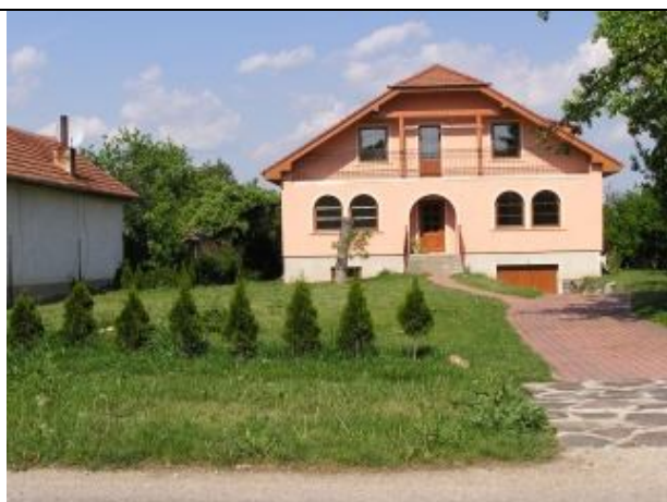
Nová farebnosť domu a oblúkovité okná nemajú nič spoločné s tradičnou architektúrou.

Objekty, ktoré znehodnocujú vidiecky ráz obce, je možné tmiť výsadbou vzrastlej zelene, tradičnými drevinami, nie drevinami cudzokrajnými, pretože tak by sa ešte zvýraznil cudzorodý prvok v obci. V obci sa objavili domy s nepôvodnou architektúrou (tzv. „podnikateľské baroko“) jednak v historickej zástavbe (čo je na škodu obce, avšak zase nie je ich zatiaľ veľa), a jednak takéto objekty sú sústredené do novej ulice pod kostolom. V prípade záujmu občanov i naďalej o takúto výstavbu veľkoobjemových rodinných domov (trend je ustupovať od ich výstavby) je možné takéto objekty sústrediť do jednej ulice, napr. pod cintorínom, aby sa nenarušil celoplošne a výrazne charakter vidieckej obce Klasov.