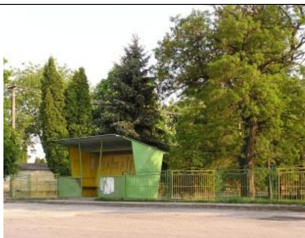
Autobusová zastávka v centre obce.

Územím prechádzajú nasledovné cestné komunikácie