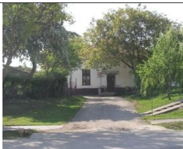
Pošta učupená pod orechom