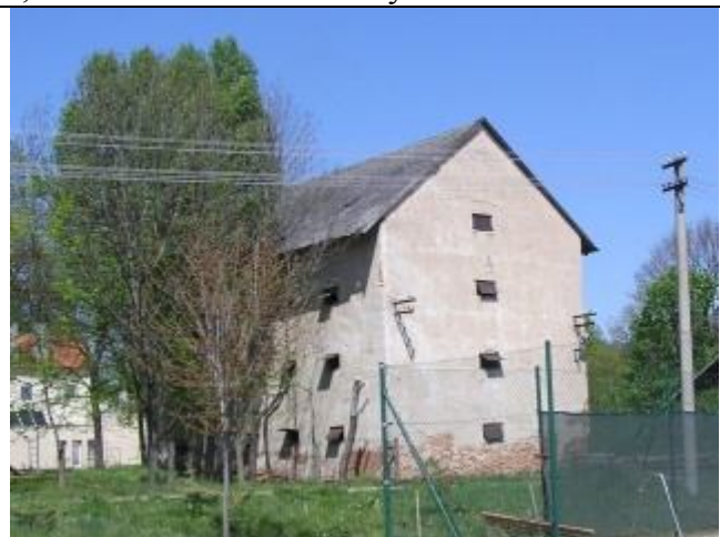
Jeden z hospodárskych objektov - sýpka