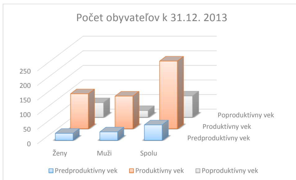
Graf č. 2 – Počet obyvateľov z hľadiska produktivity