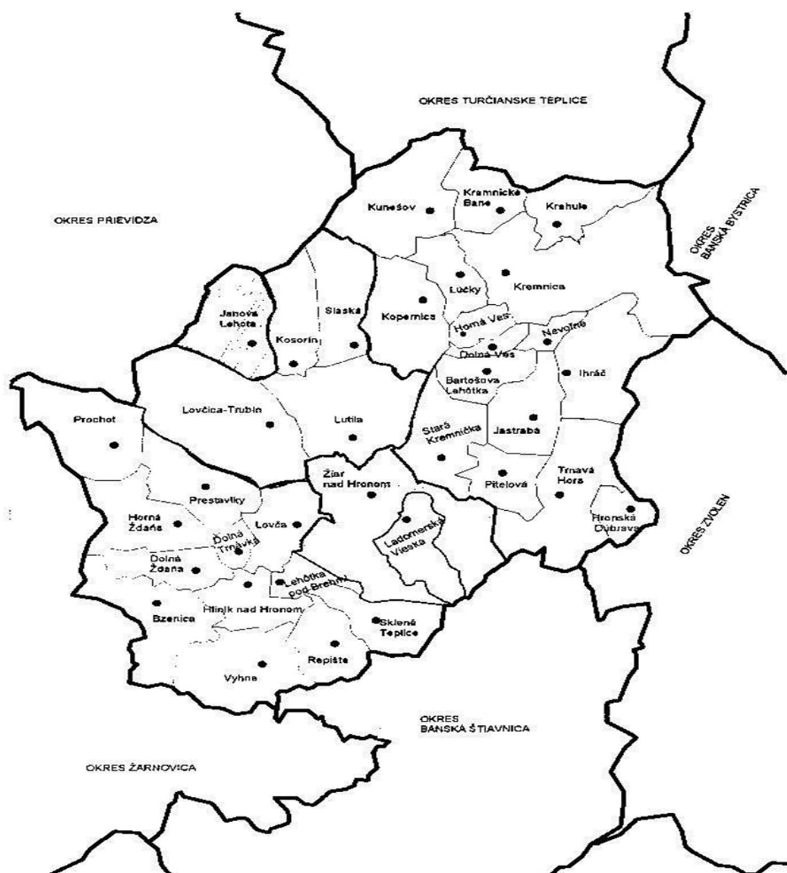
Obrázok č. 1 – poloha Janovej Lehoty v rámci regiónu