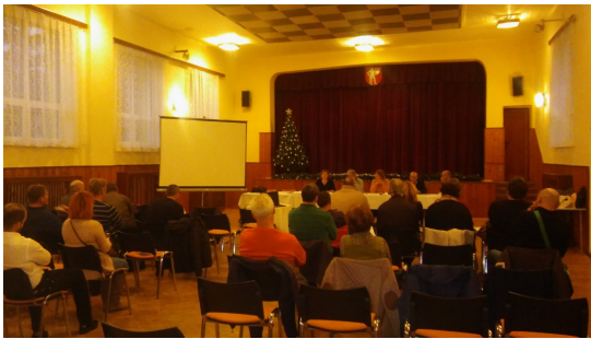
Fotografie projektu - po realizácii