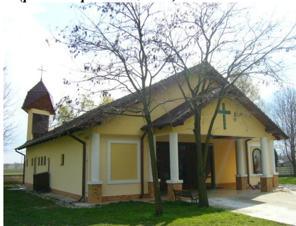
Obrázok č. 4: Kaplňka Sedembolestnej Panny Márie