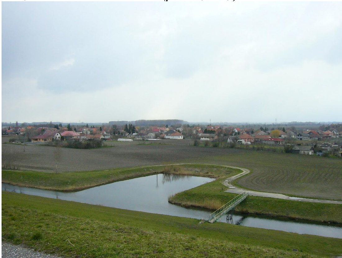
Obrázok č. 2: Trstené chatky (typické pre obec)