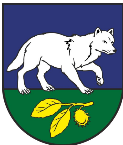
Obrázok 1 Erb Obce Šmigovec