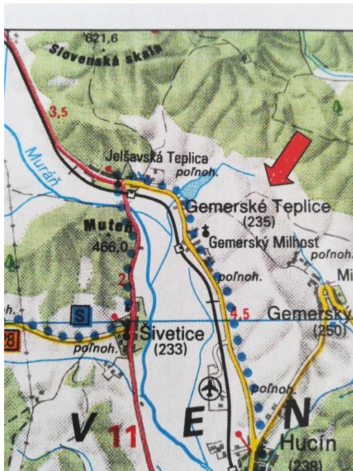
Obrázok 1 Mapa polohy obce Gemerské Teplice

Gemerské Teplice ležia v severnej časti Slovenského krasu, juhovýchodne od Jelšavy, vo východnej časti okresu Revúca aj Banskobystrického kraja. Nadmorská výška v strede obce je 235 m n. m., v chotári 230 - 492 m n. m. Pahorkatinný až vrchovinný povrch chotára po oboch stranách rieky Muráň tvoria prevažne skrasovatené vápence. Chotár je dubom zalesnený len na východe. Vo východnom chotári je vodná nádrž napájaná vyvierackou Hlavište.