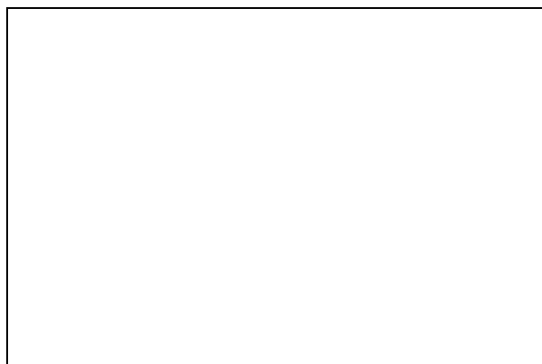
Tabuľka Kontrolný zoznam pre hodnotenie možných rizík