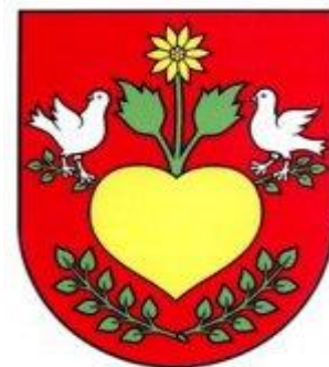
Obrázok 2 Erb obce

Erb obce tvoria v červenom poli štítu dva strieborné privrátené holuby. Pravý ohliadajúci sa – stojaci na zelených odvrátených vetvičkách, vyrastajúcich z bokov zlatého, zdola dvoma striebornými vetvičkami plytko ovenčeného veľkého srdca so zlatým, na zelenej listnatej stopke vyrastajúcim kvetom.