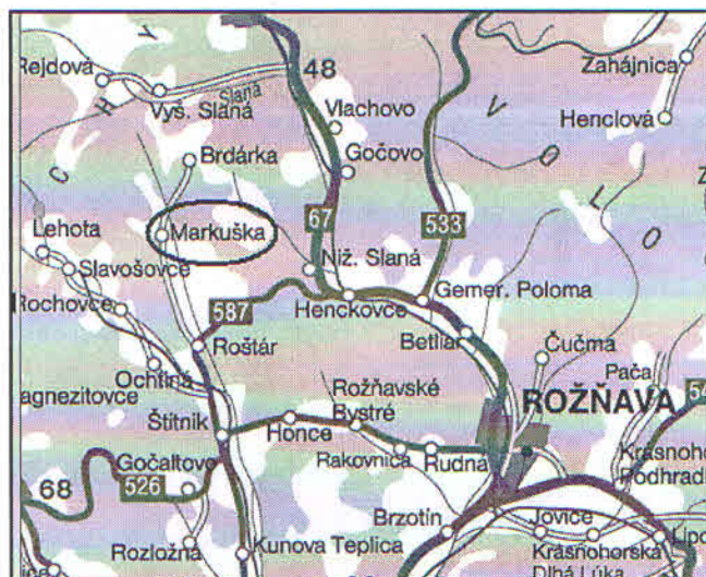
Obr.č. 1 Mapa Markuška

Kataster obce sa nachádza v nadmorskej výške 376 m n. m. a má rozlohu 6,8 km 2 . Hraničí s katastrami obcí : Slavošovce, Rochovce, Hanková, Slavoška a Kocel'ovce.