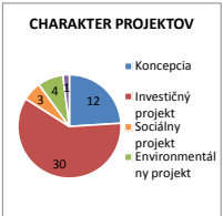
PREHLAD PROJEKTOV Z HLADISKA CHARAKTERU