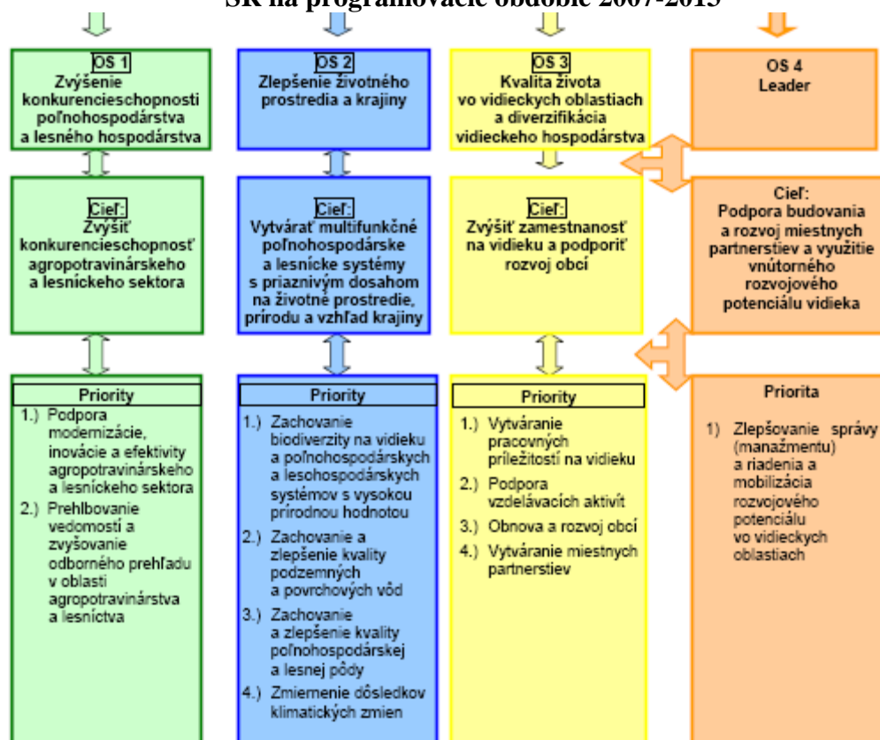
Graf 4: Prehľad osí, cieľov a priorít Národného strategického plánu rozvoja vidieka SR na programovacie obdobie 2007-2013

Prameň: Národný strategický plán rozvoja vidieka SR na programovacie obdobie 2007-2013