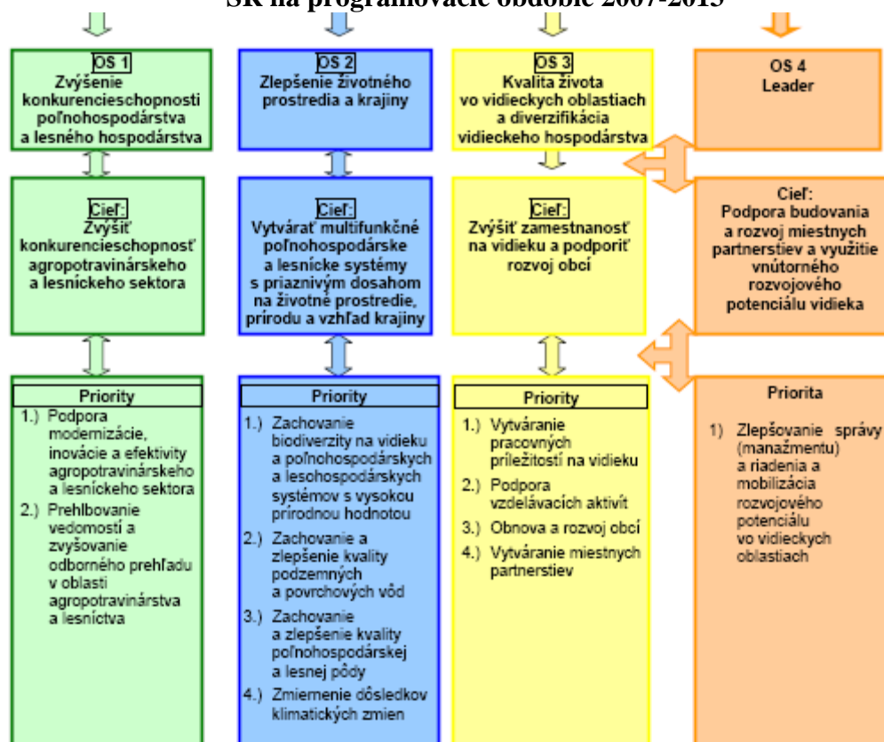
Graf 4: Prehľad osí, cieľov a priorít Národného strategického plánu rozvoja vidieka SR na programovacie obdobie 2007-2013

Prameň: Národný strategický plán rozvoja vidieka SR na programovacie obdobie 2007-2013