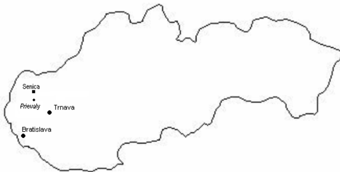
Mapa 1: Poloha obce Prievaly na Slovensku vo vzťahu k hlavnému mestu, krajskému centru a obvodnému/okresnému mestu