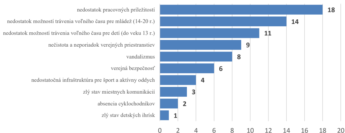
Obrázok č. 3. Najväčšie problémy v obci Dulovce podľa respondentov. Zdroj: prieskum názorov