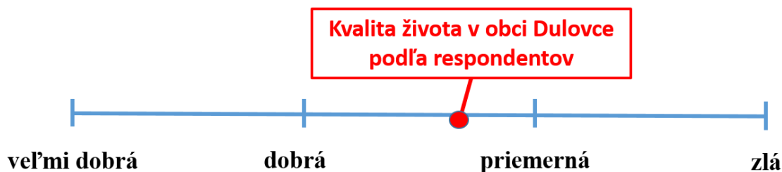
Obrázok č. 2. Kvalita života v obci podľa respondentov

Respondenti priemerne posúdili kvalitu života v obci Dulovce za lepšiu ako priemernú. Na škále od 1 do 4 (1 - veľmi dobrá, 4 - zlá kvalita) hodnotili respondenti kvalitu života priemernou hodnotou 2,68. (Obrázok č. 2.)