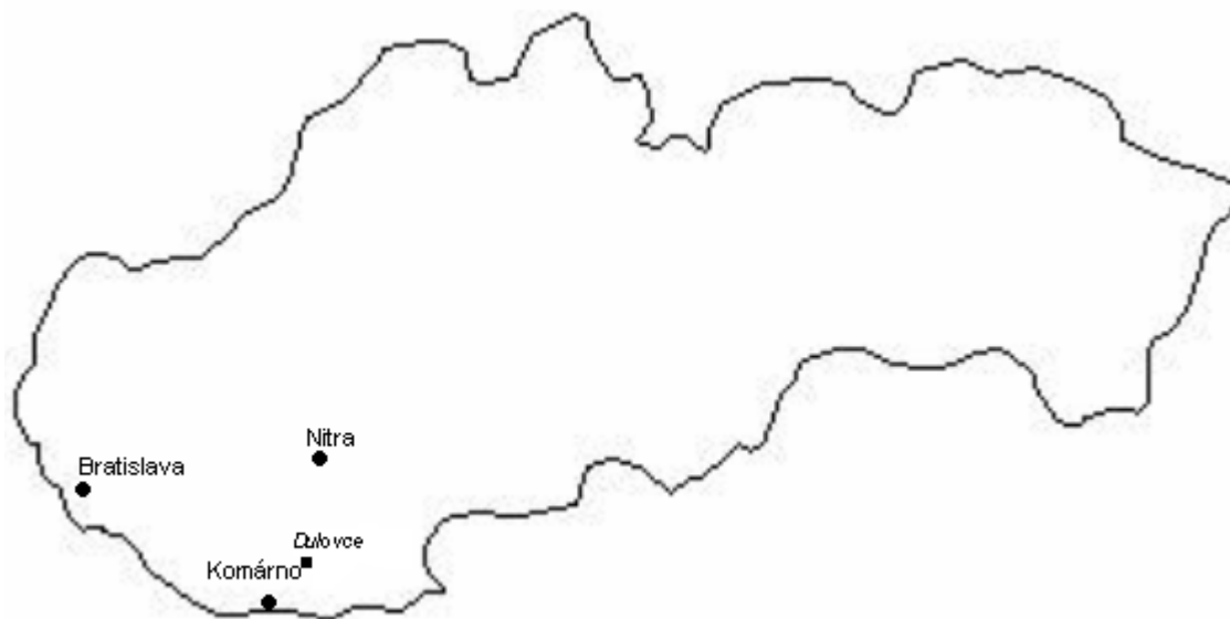
Mapa 1: Poloha obce Dulovce na Slovensku vo vzťahu k hlavnému mestu, krajskému centru a okresnému mestu