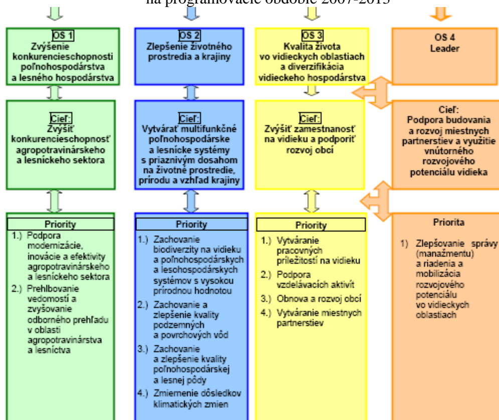
Graf 4: Prehľad osí, cieľov a priorít Národného strategického plánu rozvoja vidieka SR na programovacie obdobie 2007-2013

Prameň: Národný strategický plán rozvoja vidieka SR na programovacie obdobie 2007-2013