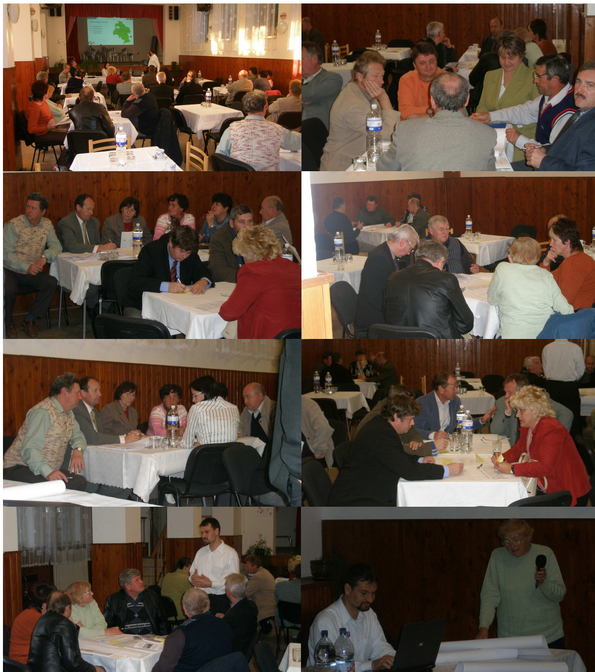
Obr. 1 – 8) Prvé stretnutie MAS v Radave 19.10.2007