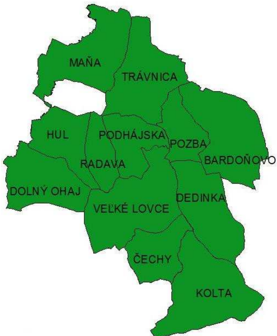
Mapa 1: Územie mikroregiónu Termál

Mapový podklad © Úrad geodézie, kartografie a katastra Slovenskej republiky č. 123-31-17214/2006