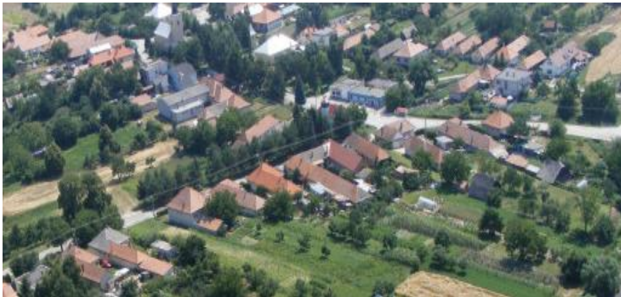
Letecký pohľad na obec Blesovce